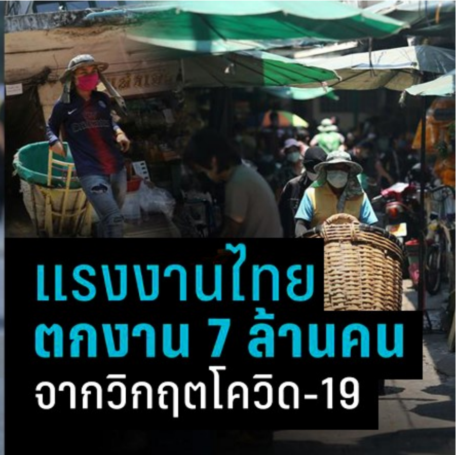
แรงงานไทย ตกงาน 7 ล้านคน จากวิกฤตโควิด-19