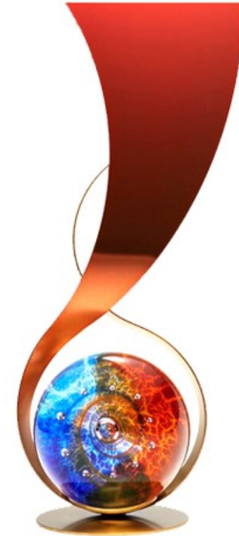
2020 GRAND PRIZE WINNERS Technology & Innovation Healthy Aging Prize for Asian Innovation