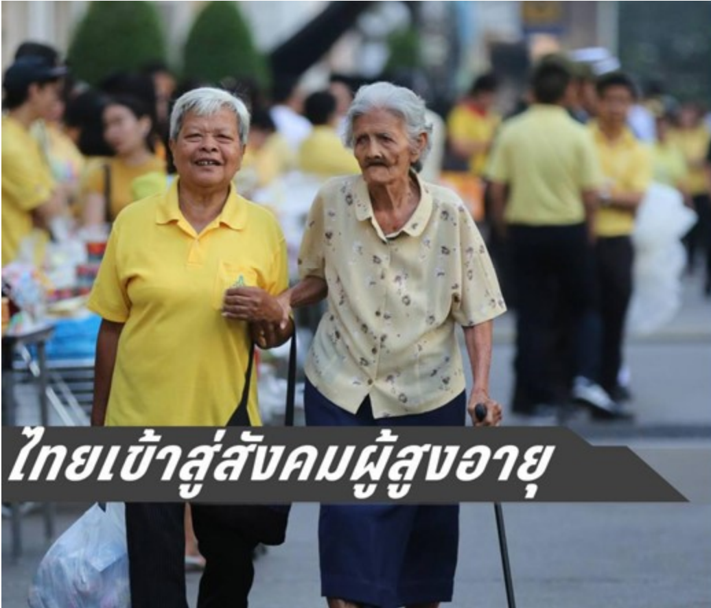
ไทยเข้าสู่สังคมผู้สูงอายุ