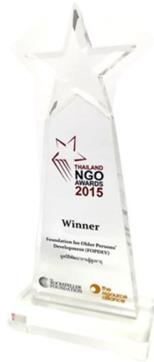
Winner Thailand NGO Awards 2015