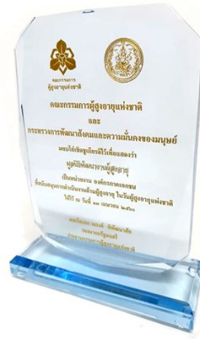
โล่เชิดชูเกียรติ องค์กรภาคเอกชนที่สนับสนุน การดำเนินงานด้านผู้สูงอายุ ปี 2560