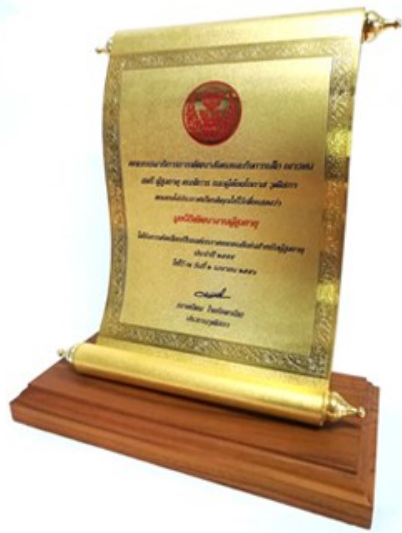
รางวัลองค์กรเอกชนดีเด่น สำหรับผู้สูงอายุ ประจำปี 2555